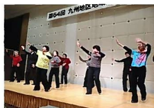
九州地区婦人大会の様子