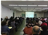
協育ネットワーク研修会(白粉)