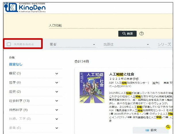
所蔵タイトルのみ