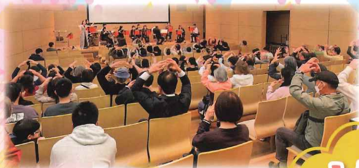
令和7年度大分県庁職員吹奏楽団クリスマス演奏会